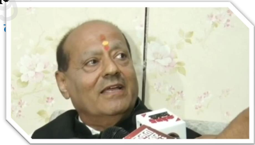
पदभार ग्रहण 27 JUNE 2024